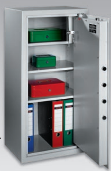
img.: AS 1000

Für die Lagerung von kleinen Mengen Akten im Büro- oder zu Hause. Schutz vor leichtem Zugriff.