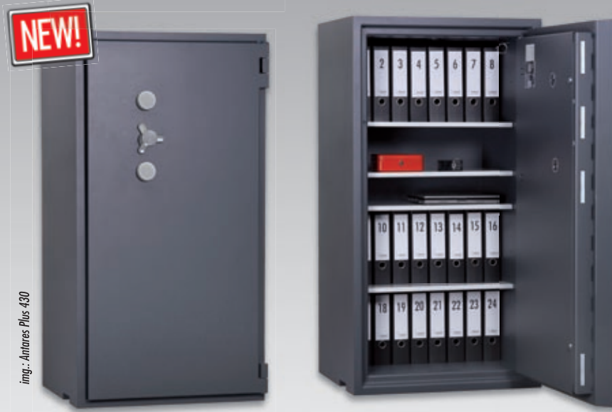
img.: Antares Plus 430

Die High-Tech Tresore unter den Wertschutzschränken. Ein zusätzlicher Krohnenbohrschutz schützt hohe Tageseinnahmen ebenso, wie Edelmetalle, geheime Dokumente. Vielfältig einsetzbar auch in Kombination mit elektronisch gesteuerten Mietfachanlagen.