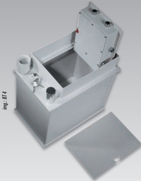
img.: BT 4

Bodentresore sind vor neugierigen Augen optimal zu verbergen. In der Neubauphase ist der Einbau leicht zu planen. Durch die zusätzlichen Einwurfsutzen kann der Bodentresor als Geldabwurf genutzt werden!