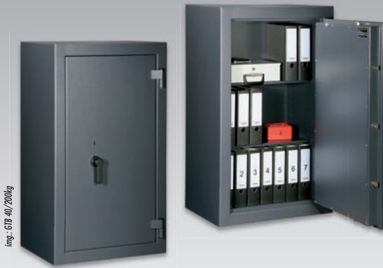
img.: GTB 40/200kg

Schwere Geschäftstresore in der Sicherheitsstufe „B“ (nach VDMA 24992 - Stand Mai '95) für deutlich höhere Richtwerte in der Versicherung. Für den privaten und gewerblichen Gebrauch. Zur Lagerung von Akten aber auch zur Sicherung von Bargeldbeständen.