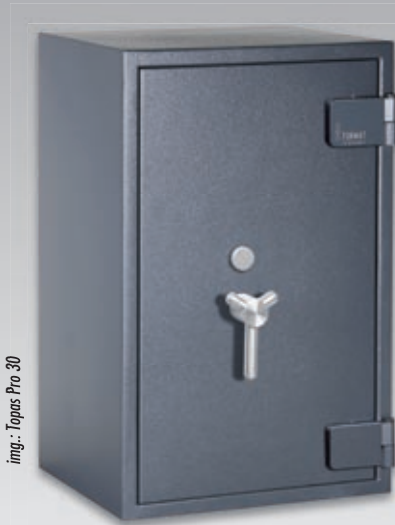
img.: Topas Pro 30