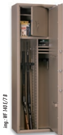
img.: WF 140 E/7 B

Safe Dry – Luftentfeuchter mit natürlichem Speichergranulat und Feuchte-Anzeiger. Im Schutzkarton verwendbar. Abtropfsicher und am Heizkörper regenerierbar. Artikel-Nr. A1015284 – VE 16 Stk.