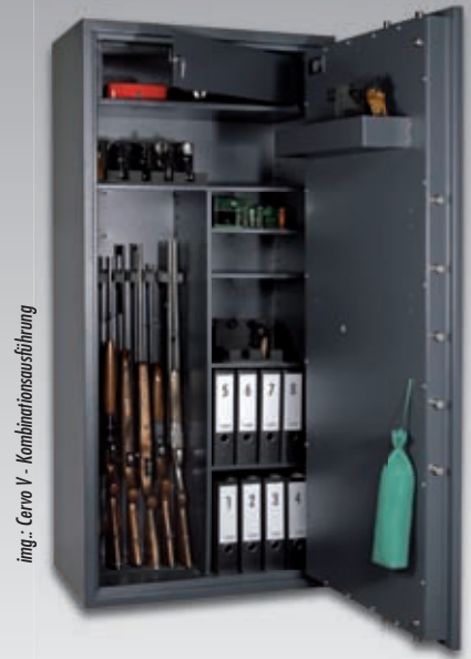
img.: Cervo V - Kombinationsausführung