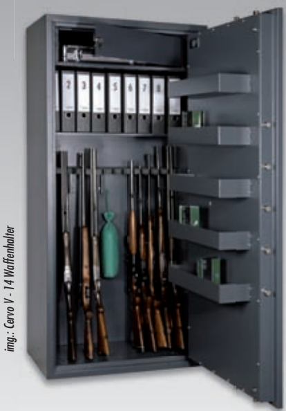
img.: Cervo V - 14 Waffenhalter