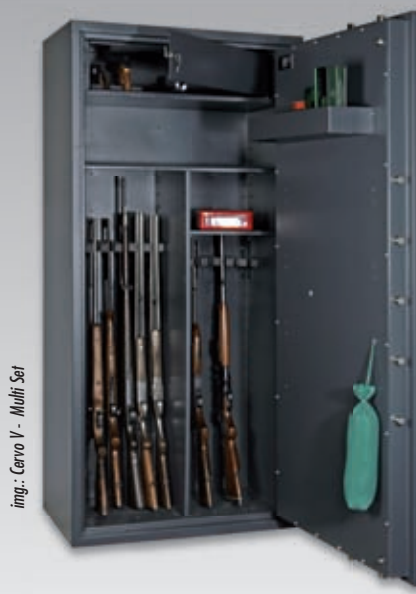
img.: Cervo V - Multi Set