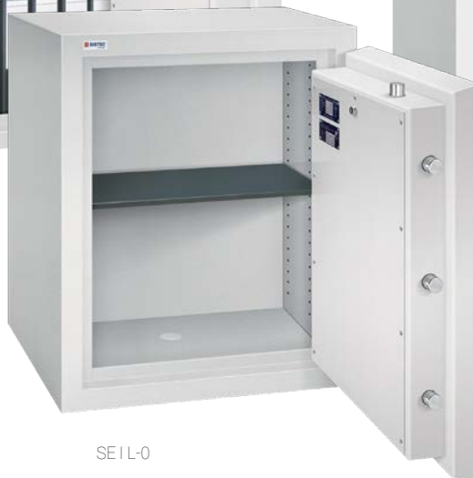
SE I L-0