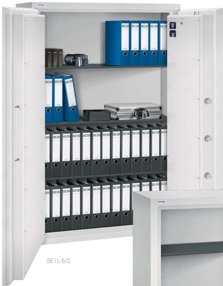
SE I L-6/2