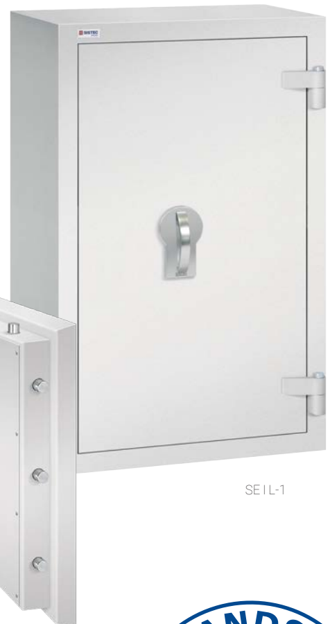
SE I L-1