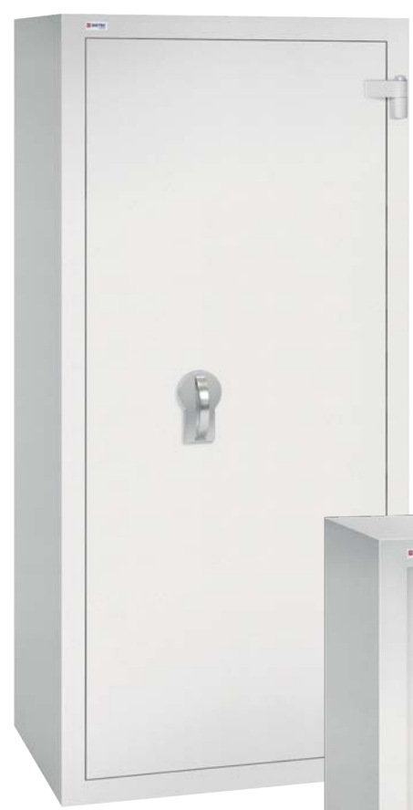
SE II A 5