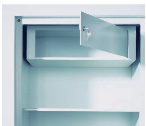
Innenfach mit Zylinderschloss (Sonderausstattung)