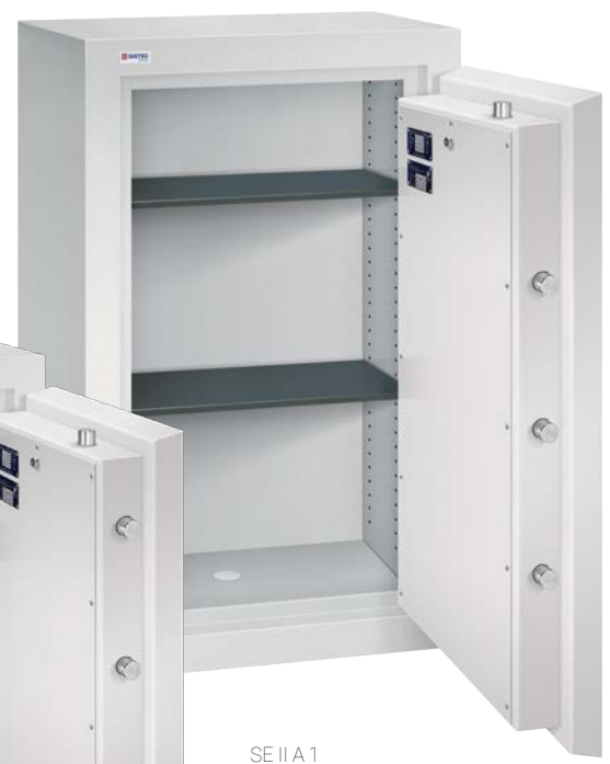
SE II A 1