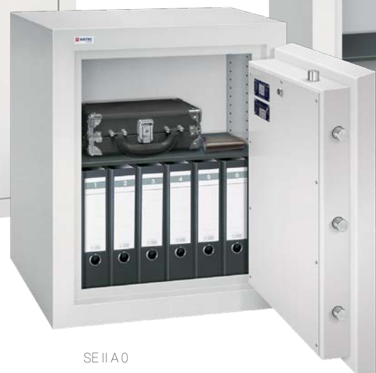
SE II A 0