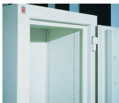
Durchgehende Stelleisten für Fachböden Verstellmöglichkeit für Fachböden im Raster von 15 mm