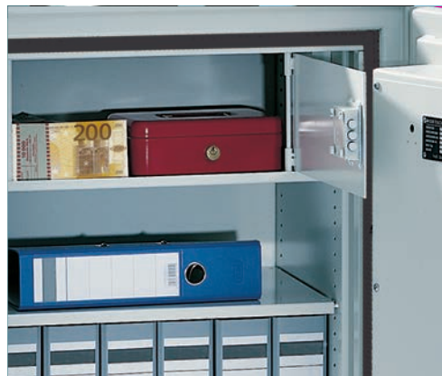
Separat verschließbares Innenfach