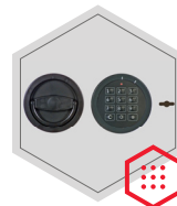
Elektronischeschloss kombiniert mit mechanischer Revision