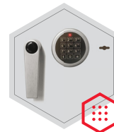
Elektronischeschloss kombiniert mit mechanischer Revision