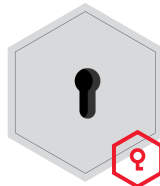
Vorrichtung für Profilhalbzylinder- Schloss