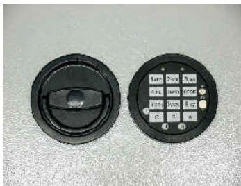
Art.-Nr. 11022, 12 mm vorstehend, gg. Mehrpreis