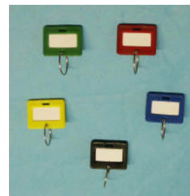
Art.-Nr. 10026 Schlüsselanhänger gg. Mehrpreis

Sonder-Maße und Ausführungen gg. Mehrpreis lieferbar. Leistungsmerkmale mech. Zahlen- und Elektronikschlösser s. Sonderseiten Schlösser und Beschläge !