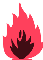
S 60 DIS

S60DIS = 60 Min. zertifizierter Feuerschutz für Daten durch besondere Betonfüllstoffe und spezielle Dichtungen. Erfolgreicher Feuerwiderstands- sowie Feuerstoßtest bis 1090°C und Sturztst aus 9,15m Fallhöhe.