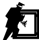
Klasse 1 EN 1143-1

CD-ROM: 2 Schubladen mit 4 Reihen a 33 St. = 264 St. 3 1/2 : 3 Schubladen mit 5 Reihen á 99 St. = 1485 St. 8mm DAT-Band: 3 Schubladen mit 5 Reihen a 18 St = 270 St. Mischbestückung: 264 CD-ROM + 36 8 mm DAT + 297 3 1/2' Diskette