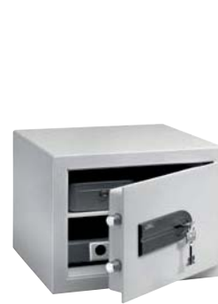
C 1 S