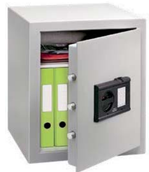
C 4 E FS