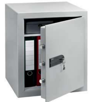
C 4 S