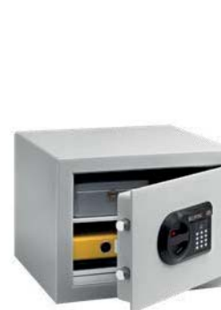
C 1 E