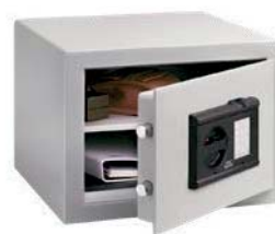
C 1 E FS