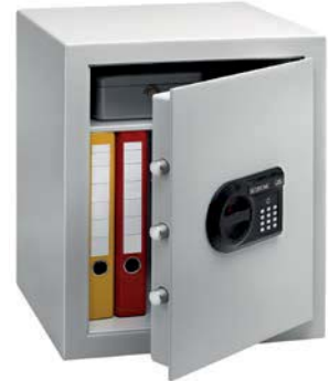
C 4 E