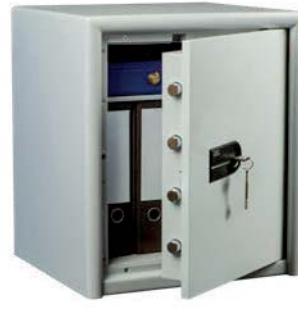
CL 40 S