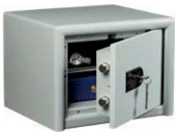
CL 10 S