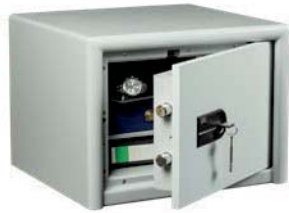
CL 20 S