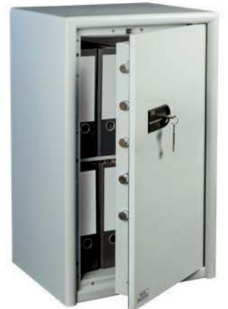
CL 60 S