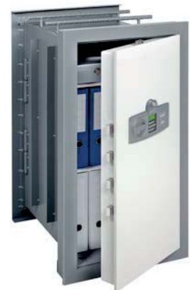
WT 10/8 580 E