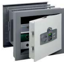
WT 10/5 350 E