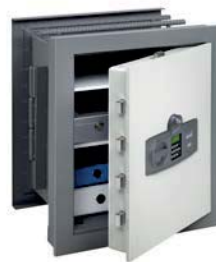
WT 10/6 350 E