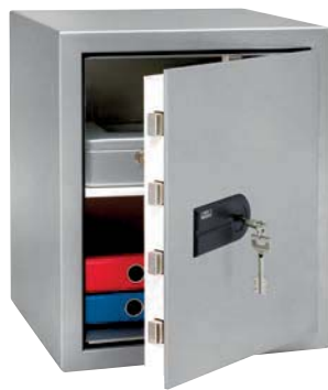
MT 26 N S