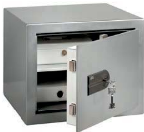
MT 24 N S