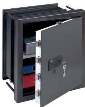
WT 16 N S