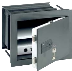
WT 14 N S