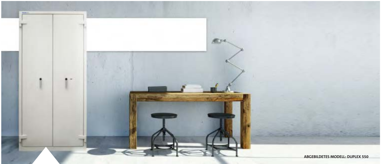
ABGEBILDETES MODELL: DUPLEX 550