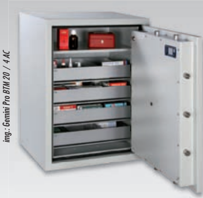
img.: Gemini Pro BTM 20 / 4 AC