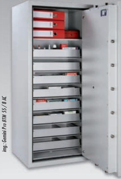
img.: Gemini Pro BTM 55 / 8 AC

Basis für diese speziellen Betäubungsmitteltresore sind Wertschutzschränke der Klasse I nach EN 1143-1. Diese erfüllen die Anforderungen und Auflagen nach §15 des Betäubungsmittelgesetzes (BtMG). Die Einrichtung mit einem hochflexiblen Schubladensystem ermöglicht eine übersichtliche Ordnung der Medikamente und Opitat.