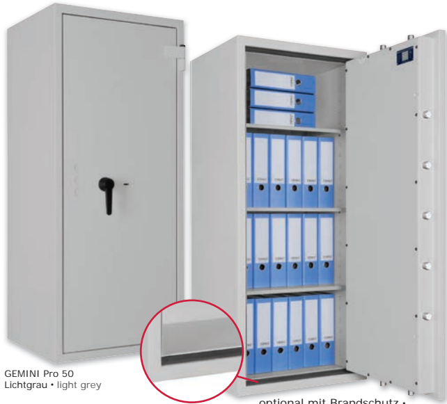
GEMINI Pro 50 Lichtgrau • light grey

Wertschutzschrank, Grad I (EN 1143-1) Safe, Grade I (EN 1143-1)