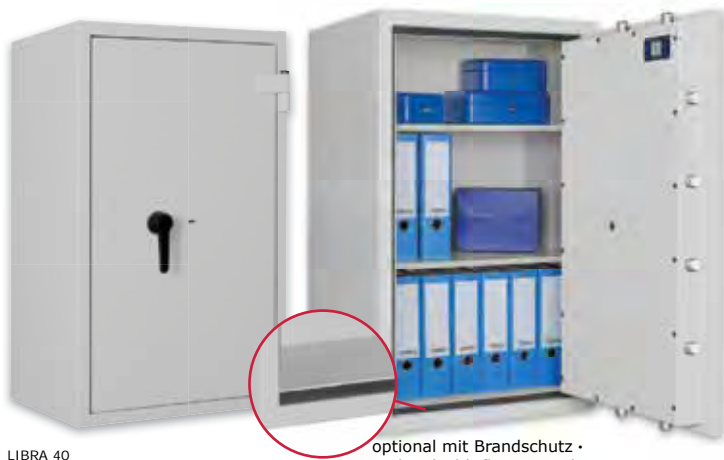
LIBRA 40 Graphitgrau • graphite grey optional mit Brandschutz • optional with fire protection Dekoration nicht im Lieferumfang enthalten • decoration not included in the delivery

Wertschutzschrank, Grad N/O (EN 1143-1) Safe, Grade N/O (EN 1143-1)