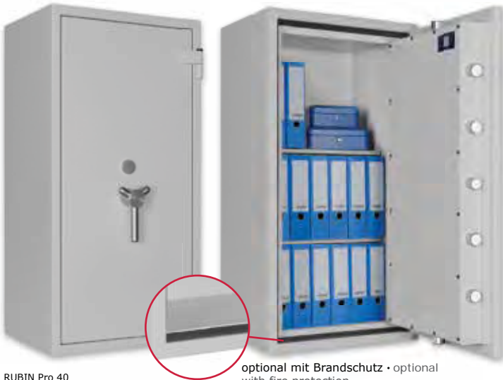
RUBIN Pro 40 Lichtgrau • light grey Dekoration nicht im Lieferumfang enthalten • decoration not included in the delivery optional mit Brandschutz • optional with fire protection

Wertschutzschrank, Grad III (EN 1143-1) Safe, Grade III (EN 1143-1)