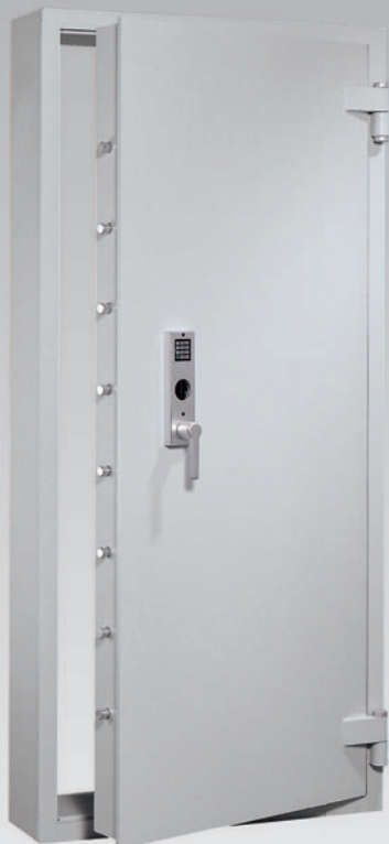
Abb.: AVB 20, Blockzarge (mit Sonderausstattung EZ Code Combi B)