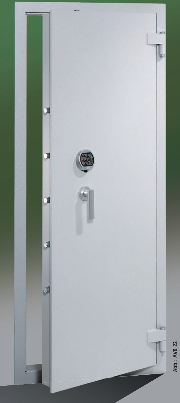
Abb.: AVB 22