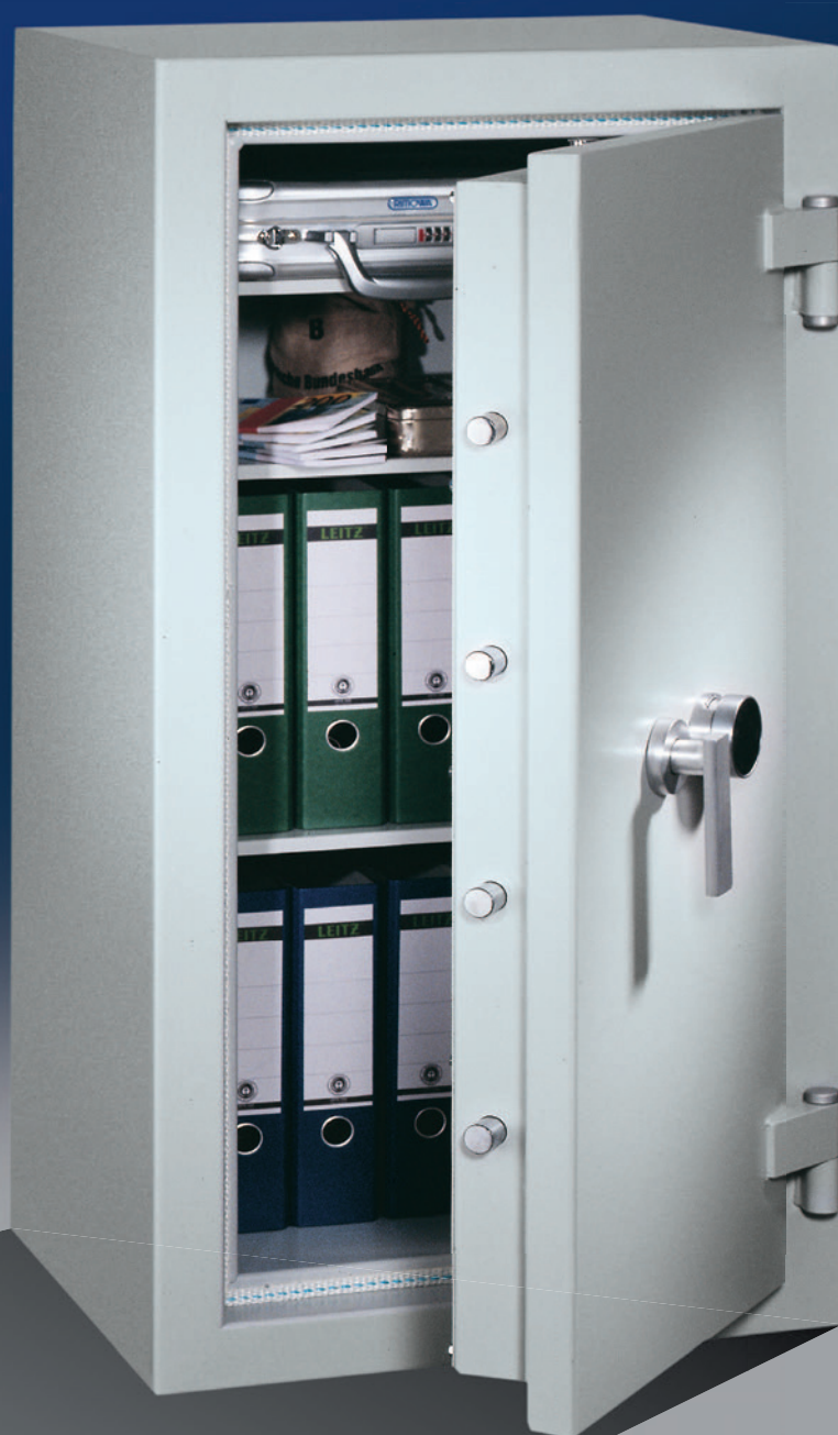
Abb.: EN 1-120 (mit Sonderausstattung ZKS)