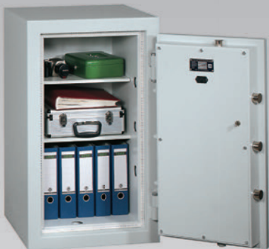
Abb.: EN 1-100