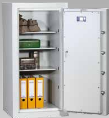
Abb.: EN 3-120