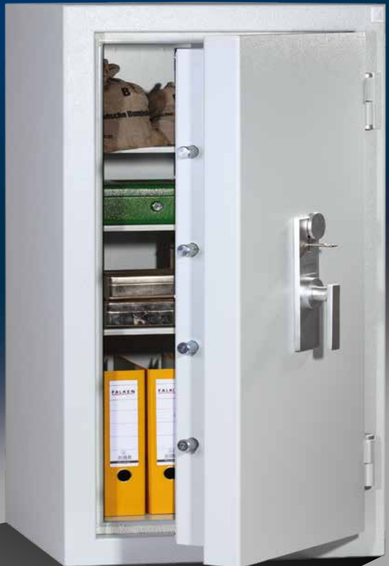
Abb.: EN 3-120