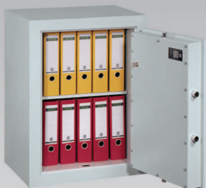
Abb.: EV 0-80