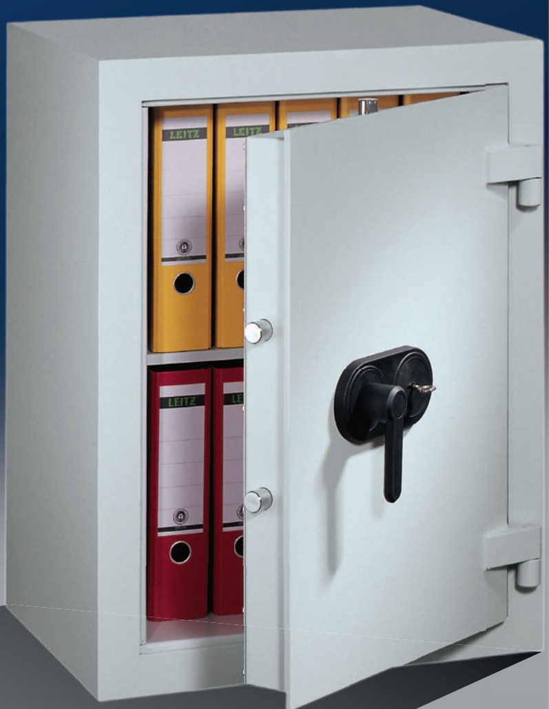
Abb.: EV 0-80