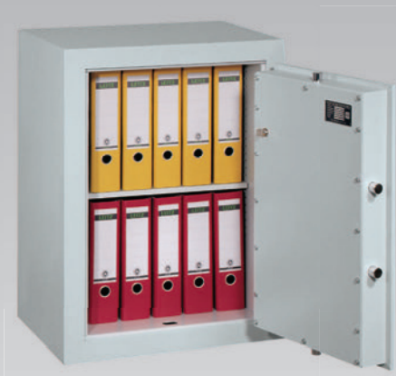
Abb.: EV 1-80