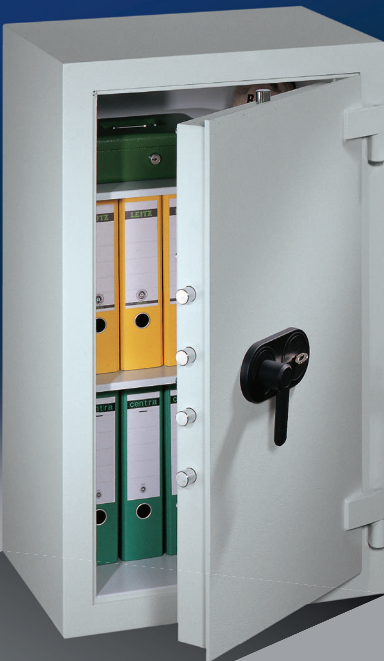
Abb.: EV 1-100