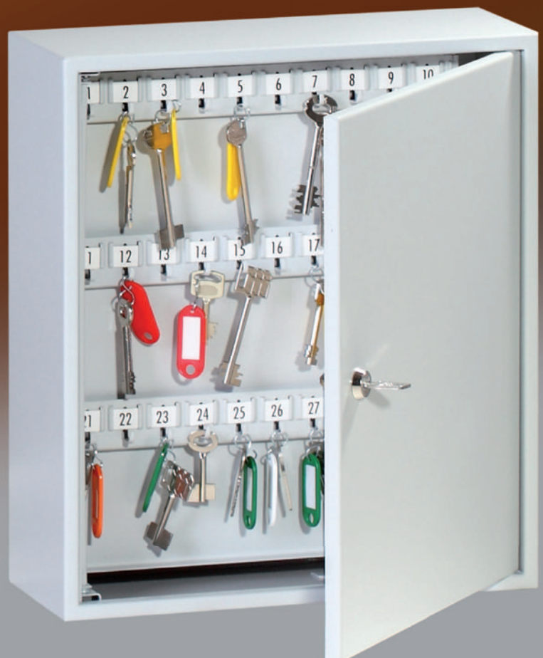
Abb.: K 100

Ummantlung ohne Angriffspunkte; Schlüsselleiste verstellbar, mit stabilen Metallhaken