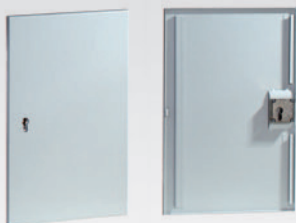
Abb.: Tür mit Vorrichtung für Profilhalbzylinder