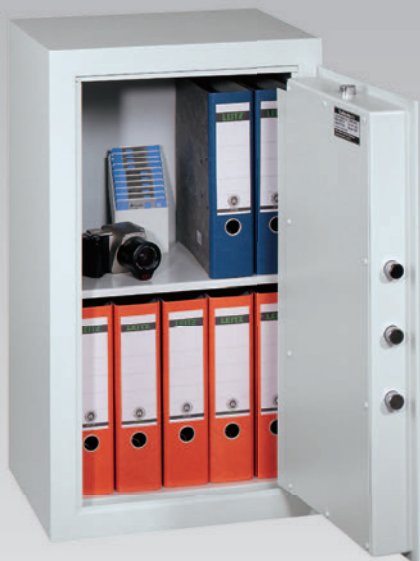
Abb.: MLE 81