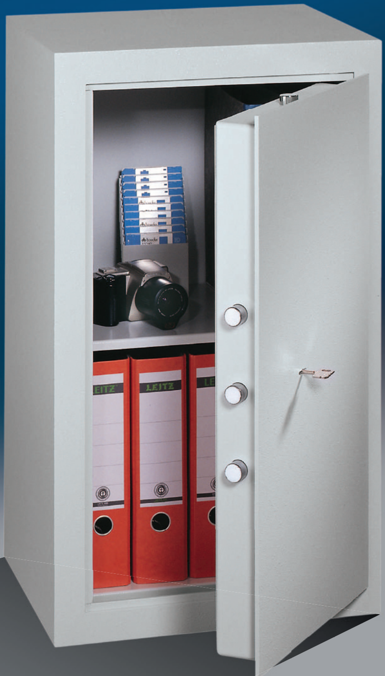
Abb.: MLE 81