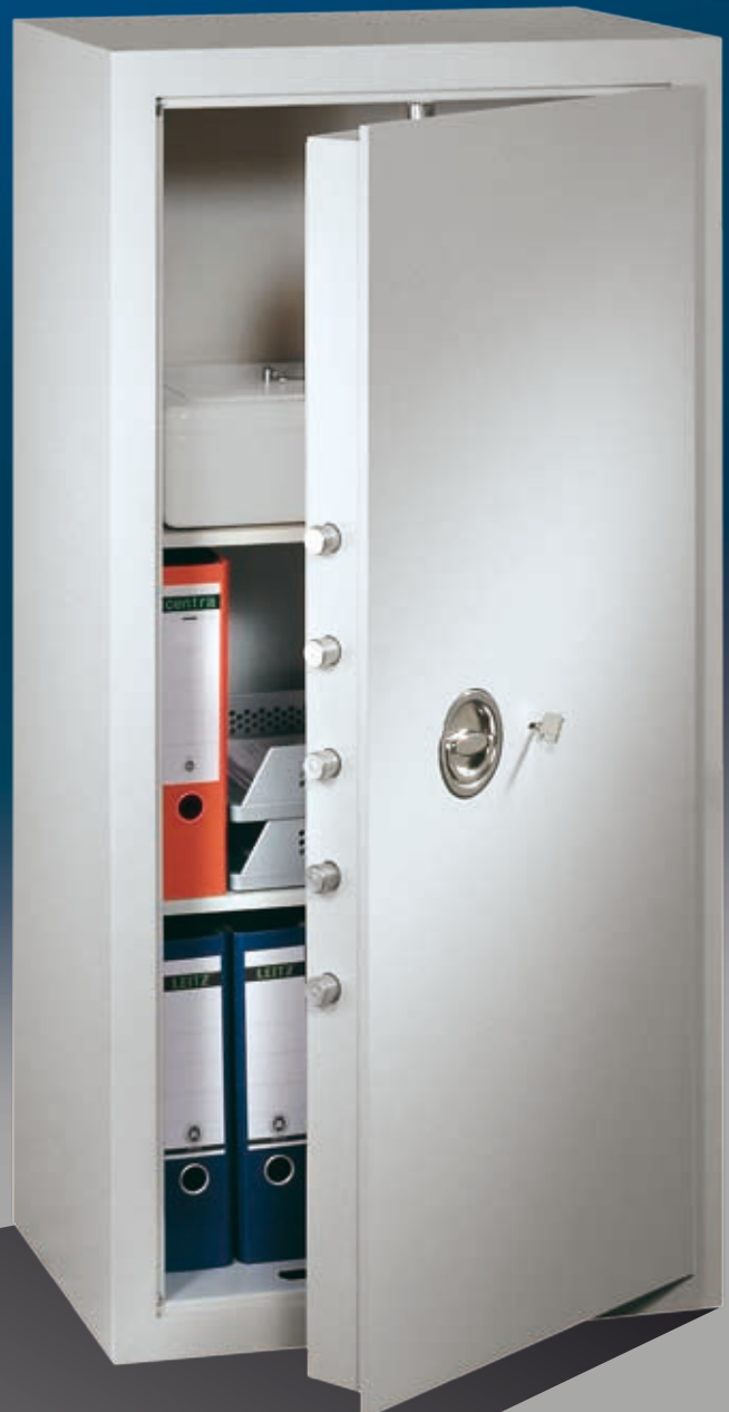
Abb.: MNO 12