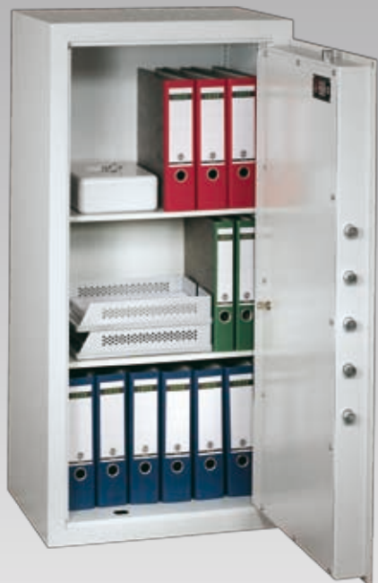
Abb.: MNO 12