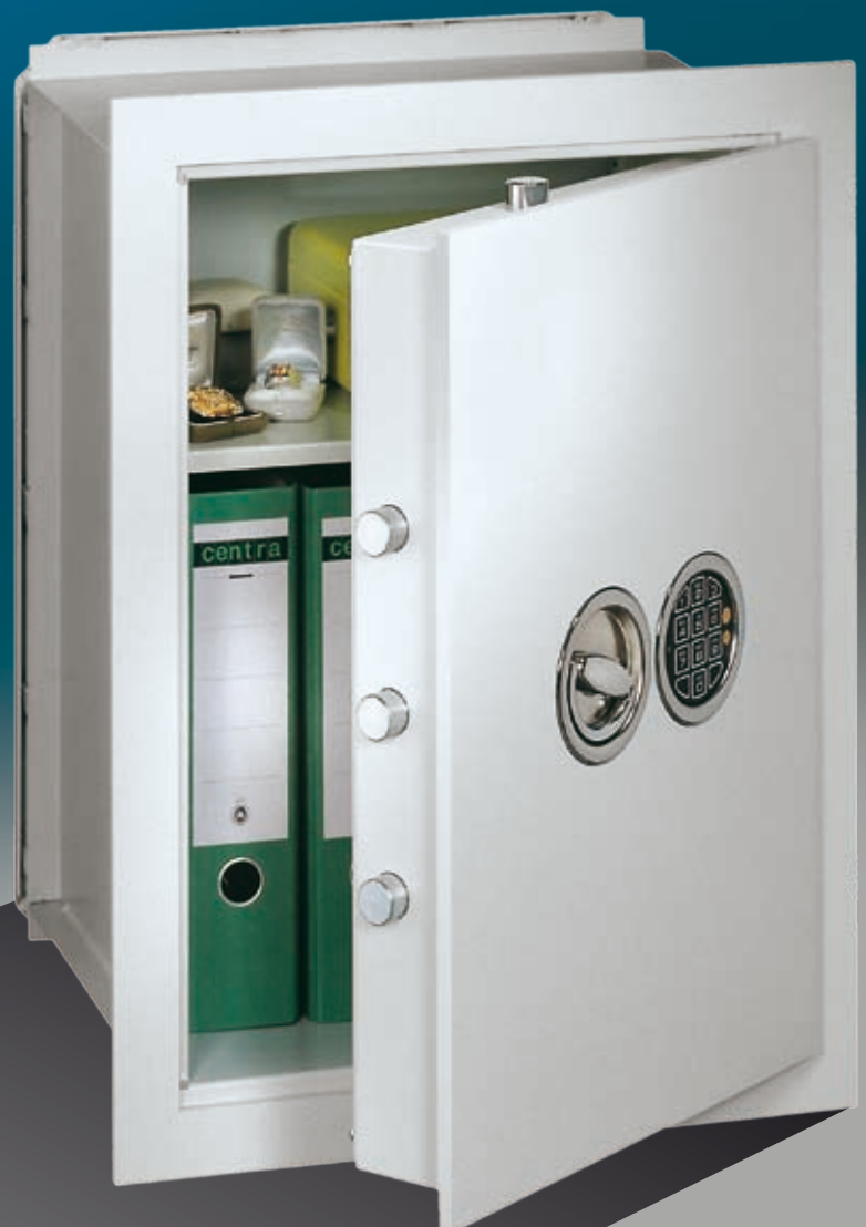
Abb.: VCO 6 (mit Sonderausstattung EZ LG Basic versenkt)