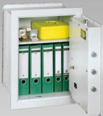
Abb.: VCO 6