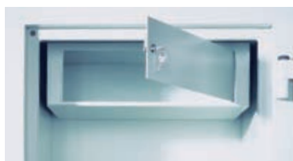
Innenfach mit Zylinderschloss (Sonderausstattung)