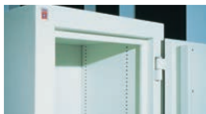
Durchgehende Stelleisten für Fachböden Verstellmöglichkeit für Fachböden im Raster von 15mm