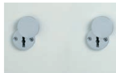
Grundausrüstung: 2 x DSS mit Schlüsselrosette (Standard)