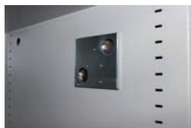
Vorbereitung für eine Alarmkomplettausstattung