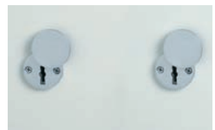
Grundausrüstung: 2 x DSS mit Schlüsselrosette (Standard)