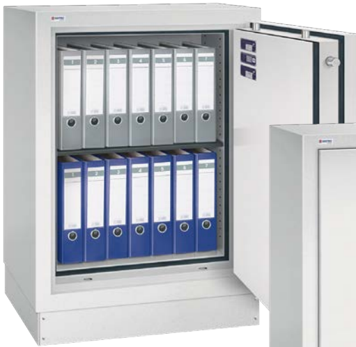
SPS 117-1 S60P