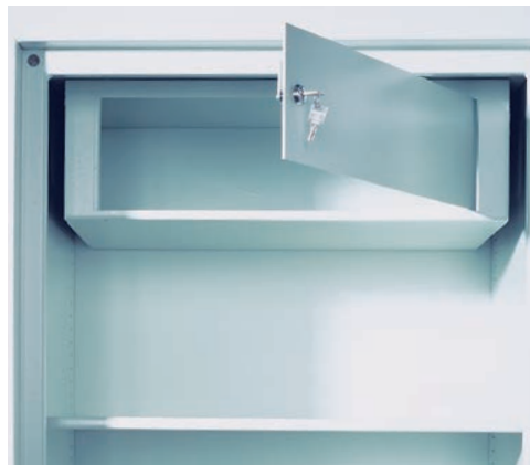
Innenfach mit Zylinderschloss (Sonderausstattung)