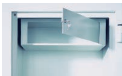
Innenfach mit Zylinderschloss (Sonderausstattung)