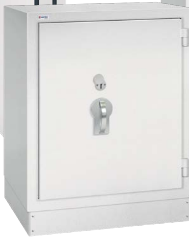
SPS 107-1 S60P