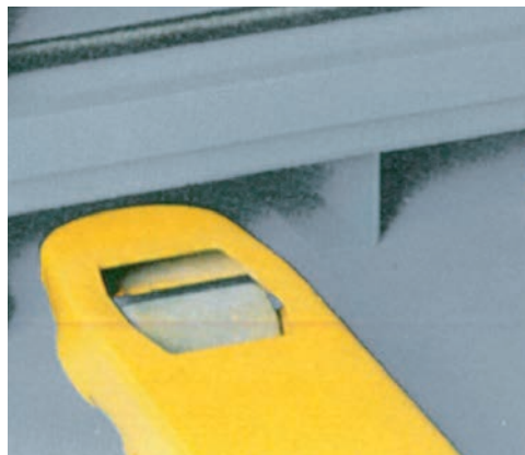
Praktisch und kostenbesparend: serienmäßig integrierte Transportvorrichtung