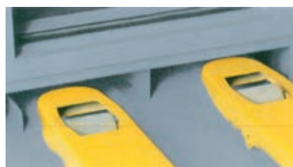
Praktisch und kostensparend: serienmäßig integrierte Transportvorrichtung