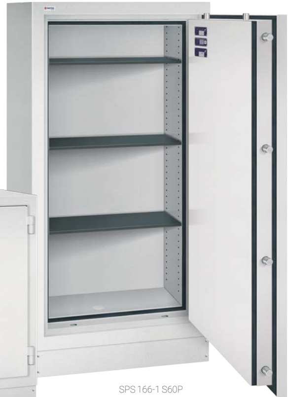
SPS 166-1 S60P