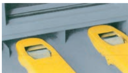
Praktisch und kostensparend: serienmäßig integrierte Transportvorrichtung