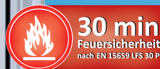
Modell TSF 1909