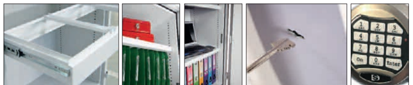
Ausziehrahmen für Hängeregister optional