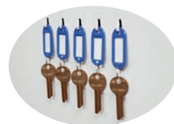
Schlüsselhaken im Inneren