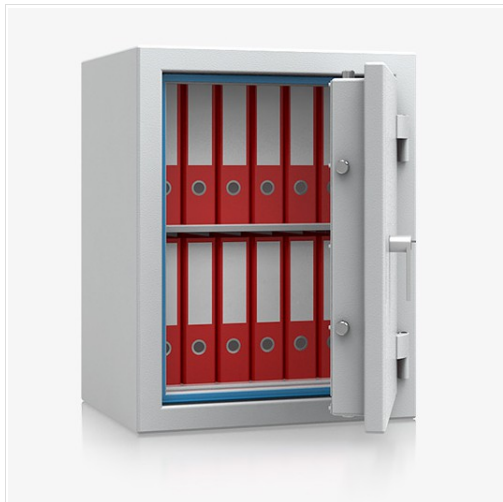
Abbildung: R410 02

Einbruchschutz bis € 65.000 und zusätzlich mit geprüftem Feuerschutz für Papiere