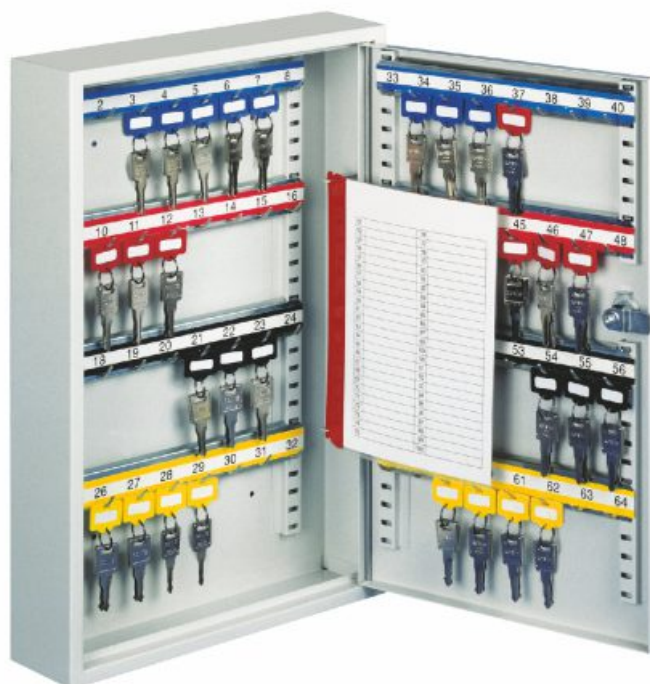
Abb.: R040 04

Lieferung erfolgt ohne Schlüsselanhänger