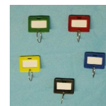
Schlüsselanhänger Art.-Nr. 04027