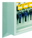
Wandeinbaurahmen vorn und hinten möglich Art.-Nr. 04026