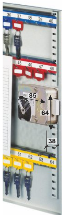
Art. 04020 - ZK-Schloss umstellbar

Hakenleisten im Raster von 14mm verstellbar