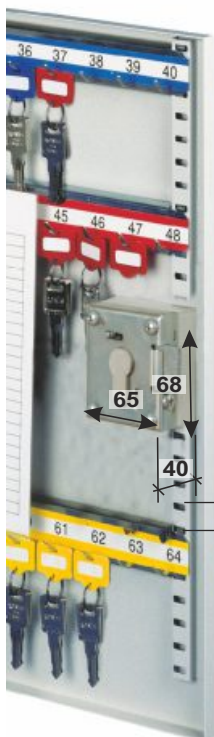
Art.04023 vorger. für PHZ (Schloss zus. Aufpreis)