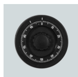
Mech. ZK-Schloss Art.-Nr. 04020

Lieferung erfolgt ohne Schlüsselanhänger