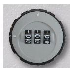
Zylinder-Zahlenschloss Art.-Nr. 04019