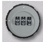
Zylinder- Zahlenschloss Art.-Nr. 07012