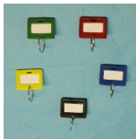
Schlüsselanhänger Art.-Nr. 07016