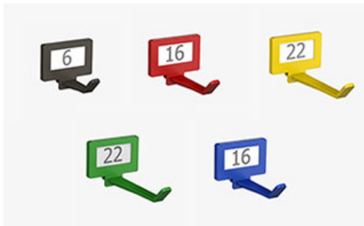
Schlüsselhaken (neue Ausführung) Art.-Nr. 07604 - 07606

Die Hakennutzung auf der Tür wird bei Einsatz obiger Schlösser gemäß den aufgeführten Maßen beeinträchtigt.