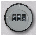
Zylinder- Zahlenschloss Art.-Nr. 07610