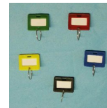
Schlüsselanhänger Art.-Nr. 07615