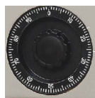
Mech. ZK-Schloss Art.-Nr. 07611