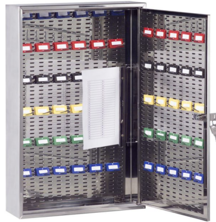
Abb.: R076 02 mit neuem Hakensystem. Haken müssen separat bestellt werden.

Durch die Vorrüstung mit Schlosskasten für Profilhalbzylinder anstatt Zylinderschloss (gg. Mehrpreis) können Sie die Schlüsselschränke in Ihre bestehende Schließanlage integrieren.