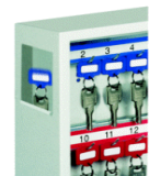
Schlüsseleinwurfschacht Art.-Nr. 13628