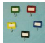
Schlüsselanhänger Art.-Nr. 13627