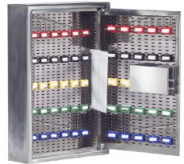
Rastersystem für verstellbare Haken