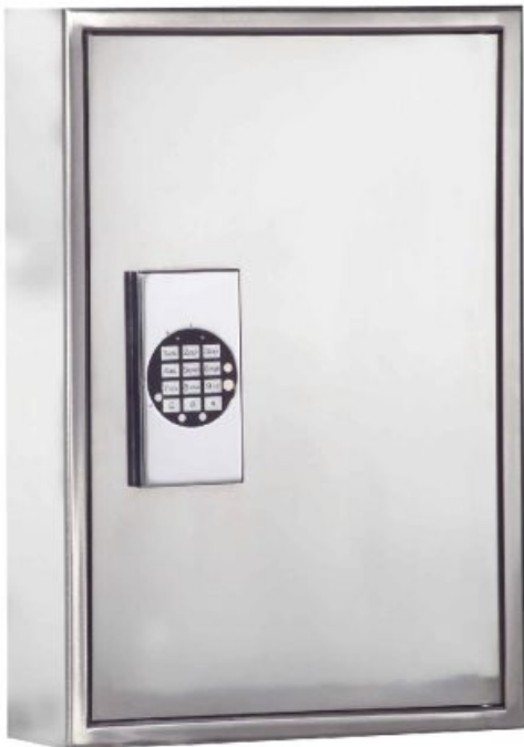
R136 01 mit Elektronikschloss gg. Aufpreis

Komplett mit höhen- und breitenverstellbarem Hakensystem in 3 verschiedenen Hakenlängen