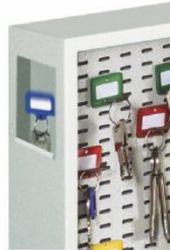
Art.- Nr.: 13628 Einwurfschacht linke Seitenwand