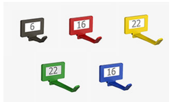
Schlüsselhaken (neue Ausführung) Art.-Nr. 13624 - 13626

Besonders geeignet im Bereich der Lebensmittelbranche: Bäckereien, Metzgereien, Molkereien, Lebensmittelläden usw. - aber auch in Außenbereichen, da rostfrei !