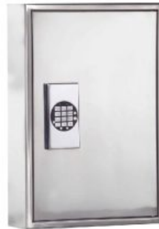
Abb.: R136 01 Elektronikschloss gg. Aufpreis

Besonders geeignet im Bereich der Lebensmittelbranche: Bäckereien, Metzgereien, Molkereien, Lebensmittelläden usw. - aber auch in Außenbereichen, da rostfrei !