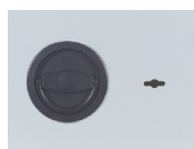
Klappgriff Kunststoff schwarz flächenbündig