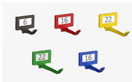
Schlüsselhaken (neue Ausführung) Art.-Nr. 15523 - 15525

Abb.: R155 00 mit Hakensystem welches die Möglichkeit bietet, die Schlüsselhaken nach den individuellen Bedürfnissen selbst einzusetzen. Darüber hinaus besteht die Möglichkeit, einen Fachboden, Art.-Nr.15529 , gg. Mehrpreis einzusetzen, da auch die Seitenwände diese Stanzungen aufweisen. Die Haken fungieren dabei als Bodenträger. Hier kann man dann Fahrzeugscheine, große Schlüsseletuis, sonstige Papiere usw. ablegen und sichern.