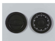
Mech. ZK-Schloss Art.-Nr. 15520 flächenbündig