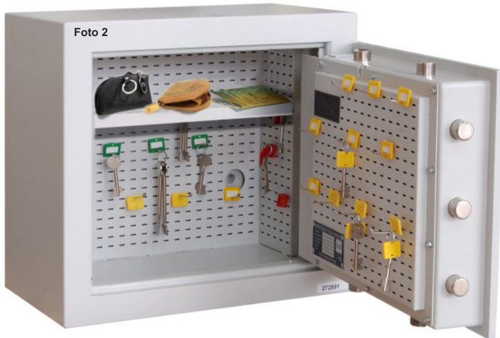
Abb.: R155 00 mit Hakensystem welches die Möglichkeit bietet, die Schlüsselhaken nach den individuellen Bedürfnissen selbst einzusetzen. Darüber hinaus besteht die Möglichkeit, einen Fachboden, Art.-Nr.15529 , gg. Mehrpreis einzusetzen, da auch die Seitenwände diese Stanzungen aufweisen. Die Haken fungieren dabei als Bodenträger. Hier kann man dann Fahrzeugscheine, große Schlüsseletuis, sonstige Papiere usw. ablegen und sichern.

Euro/VdS 2450/EN 1143-1 Klasse I geprüft u. Zertifiziert von VdS Köln Anerkenn.-Nr.M 10 00 25 und PN-EN 1143-1:2006, Klasse I geprüft u. zertifiziert von IMP Zertifikat-Nr. P41/117/01/2007 (2517),