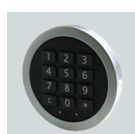
Elektronikschloss Primor 1000 L5 FL flächenbündig