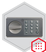
Elektronisches Kombinationsschloss (außer Art. 17000-17001)