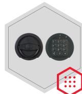
Elektronisches Kombinationsschloss (außer Art. 20000-20001)

Optionale Verschlussvarianten gegen Mehrpreis