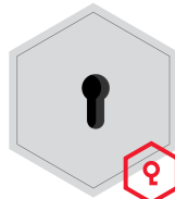
Vorrichtung für Profilhalbzylinder- Schloss